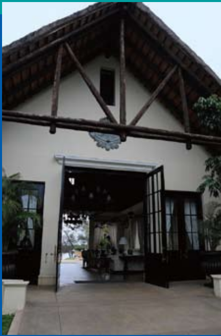
写真⑩ リビングストーン ホテル