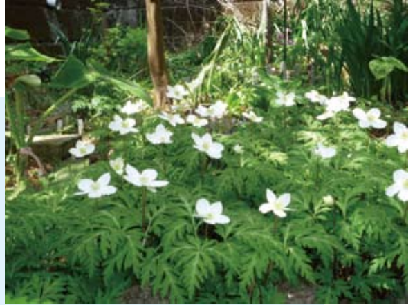
いちりんそう…やっと咲きました