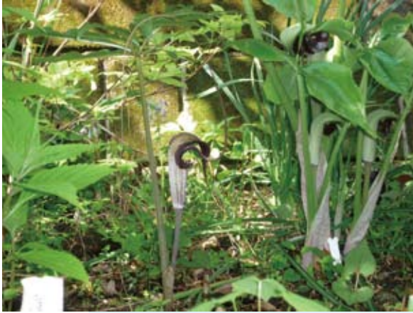
うらしまそう…釣り糸が見えますか?