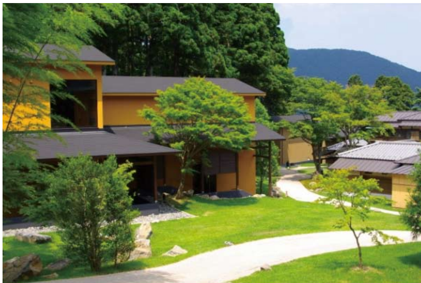
自然との共生 3,000坪の起伏に富んだ敷地