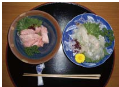
刺身と赤シソと青シソ