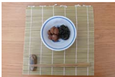
30年もの赤シソと梅干