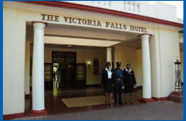
写真⑤ ビクトリア・フォールズ ホテル