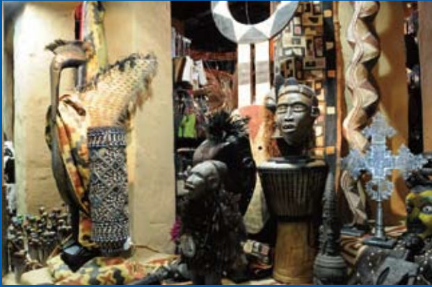
写真② 空港内の土産店