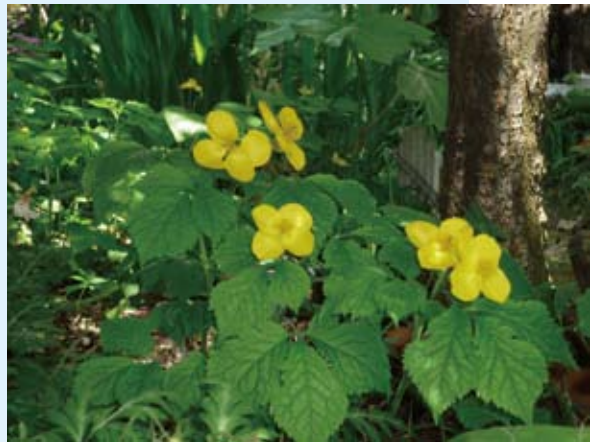
やまぶきそう…今年はちょっとさみしい