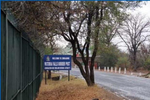
写真⑧ ビクトリア・フォールズ 入口