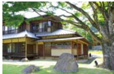
樹齢300年の紅葉がお庭にある 国登録有形文化財 レストラン「紅葉」