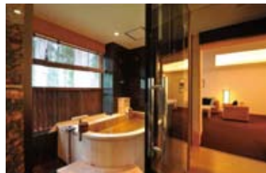
全室 自家源泉かけ流しの露天風呂完備

SPAは世界を代表する高級コスメティックブランド『sisley シスレー』。「即効性」と「安全性」を何よりも重んじ、植物が肌にもたらす力を無限大に引き出すシスレー製品の効果を、余すところなく体感していただけるトリートメントメニューを揃える。肌を知り尽くしたスペシャリストによるカウンセリングの後、肌質に合わせコースを選ぶことができる。究極のリラクゼーションで、至福の時を演