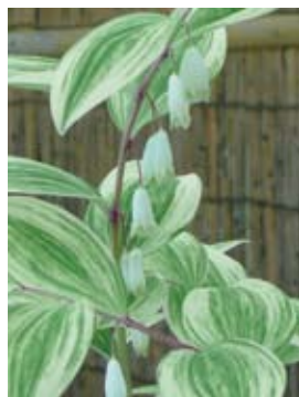
斑入りアマドコロ

シソ(紫蘇・紫蘇子) は中国由来の一年草の栽培植物である。葉も種子も日常生活には馴染みのもので、梅干・しば漬け・刺身の添え物などに利用されている。紫蘇の香りはペリラルデヒドなどの精油成分に由来し、必須脂肪酸の \alpha -リノレン酸も含まれるため、アレルギー予防やガン予防にも効果があると考えられている。これら成分を含む紫蘇には、生臭さを消す働き、防腐・殺菌作用や魚蟹中毒防止作用が存在するために古来より利用されてきた。そのため、魚や蟹で蕁麻疹が出た時は、紫蘇の葉を食べたり絞った汁を飲んだりして毒を中和し、また胃の具合が悪く食欲がない時や風邪気味のときも葉を味噌汁に入れたりして利用される。漢方では、このシソ(紫蘇・紫蘇子)の性味は辛・温であり、辛温芳香で気をめぐらせる作用が強く、経絡では、肺・脾・胃経に入る。それゆえ紫蘇は、肺の働き(呼吸機能、気の生成作用、汗腺・体温調節・免疫機能、嗅覚機能など)を強め、脾や胃の働きを強めることによって、発汗解熱したり、気を流して鬱を治したり、脾と肺の気の滞りを治し、咳が出て胸が苦しくなるのを治したりする。また胎児安定を図ったり、魚蟹毒の腹痛吐瀉に利用したりもする。そこで古来いろいろな漢方処方に利用されてきた。蘇葉は鬱や神経症などの時に使用する半夏厚朴湯、胃腸虚弱な人の感冒や胃腸疾患に使用する香蘇散、喘息や気管支炎に使用する神秘湯・蘇子降気湯・喘四君子湯などに配合されている。