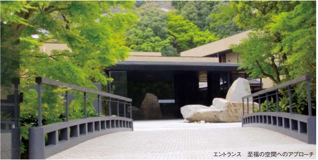
エントランス 至福の空間へのアプローチ