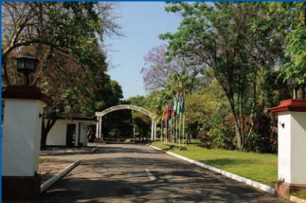
写真④ ホテル玄関へのプロムナード