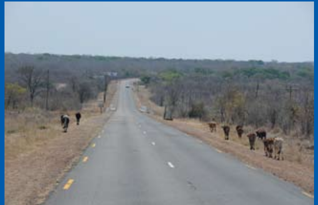
写真③ 空港より市街地への道