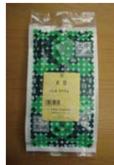
黄精 500g ¥1,300