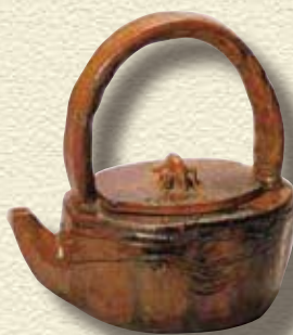
●大樋釉海老摘手付水指 初代長左衛門作 石川県指定文化財 (大樋美術館所蔵)