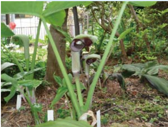
むさしあぶみ…ちょっと不気味