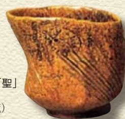
●大樋釉茶碗 銘「聖」 初代長左衛門作 (大樋美術館所蔵)