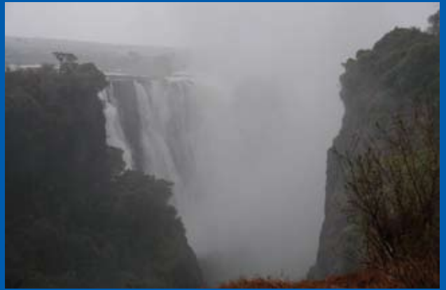
写真⑨ ビクトリア・フォールズ