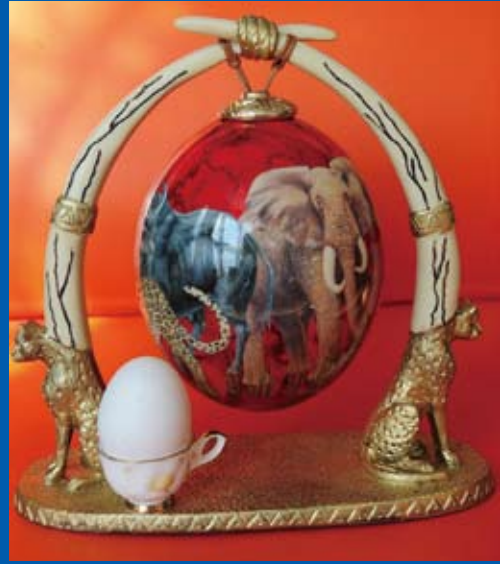
写真① 土産品の駝鳥の卵と鶏卵