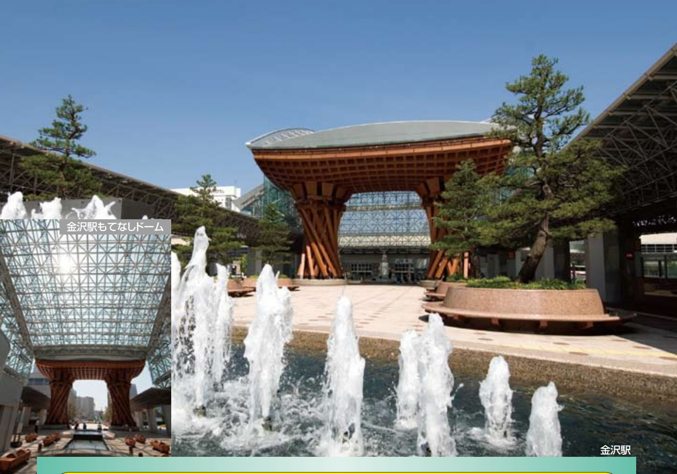
金沢駅もてなしドーム