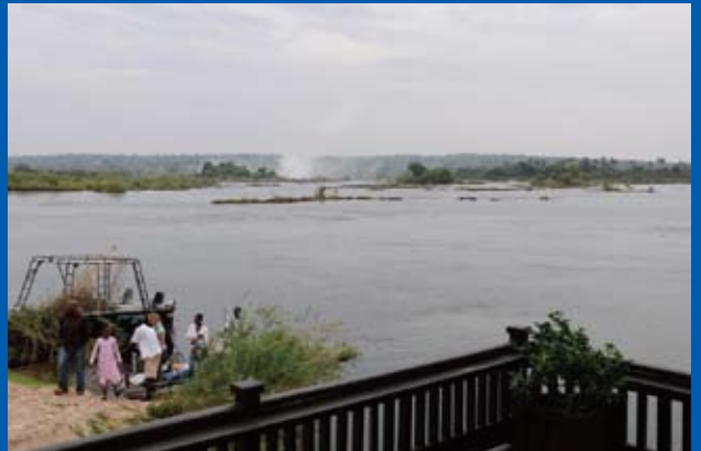
写真⑪ ホテル裏庭から

の探検家リビングストーンによって発見された。当時のイギリス女王の名をとり、ビクトリア・フォールズと命名された写真⑧。ザンベジ川の緩やかな水は轟音をとどろかせビクトリア滝壺に落ち、水煙となつて150m以上も上空に舞い上る。最大幅1700mで道順が表示されるメインフォールズ、レインボーキャラット、デビルズキャラット等写真⑨、六つのパートに分れている。あいにくの雨のため、レインボー滝には残念ながら虹はでてなかった。 午後は雨も止み、国境を越えてザンビアから滝を見に行った。昼食は、リビングストーンホテル写真⑩で取るように車をまわしてもらった。滝の上流に位置するこのホテルの裏庭からは、ビクトリアの滝の水煙が上っており、庭にはのんびりした縞馬を見ながら昼食写真⑫。 翌日は晴天で、ヘリコプターによる滝上空遊覧は壮大で虹もかなり素晴らしかった。ヘリに搭乗する時と降りる時の我々カップルのビデオ写真をビデオの前と後に編集し、中は観光用に撮影された上空からのビクトリア・フォールズCDを記念に購入した。なかなか商売上手である。午後には学会参加のためケープタウンに向った。