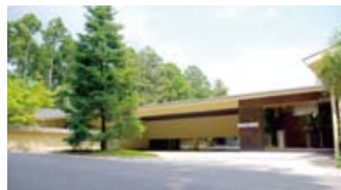
箱根の雄大な自然の中に たたずむエントランス