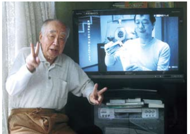
“社会の窓”を閉めるのも忘れて喜んでいます

番号を見直しても間違いない。老妻と二人きりの所帯、大声出して呼び寄せて確かめあって差出人を見れば吾が息子。不思議な出来事に二人とも唾然として声なしの状態であった。翌日愚息に電話すれば吃驚と大喜び、孫と嫁と二人で「一生の親孝行がこれで済んだ、バンザイ。」と吐かした。 家族中で何を云うていても大喜びに変わりは無い。早速郵便局へ全部の当たりはがきを持って行った。受付のオネエちゃん吃驚した顔して、「これだけ一度に当選されたのはこの郵便局始まって以来です。握手して下さい。福下さい。」おまけに上司を呼び寄せて握手して貰いなさいと云って上司とも握手をさせられた。 当日カタログをみて記入し提出した。旬日後シャープの京都営業所より連絡があり、ブルーレイ付き地デジの大きいテ