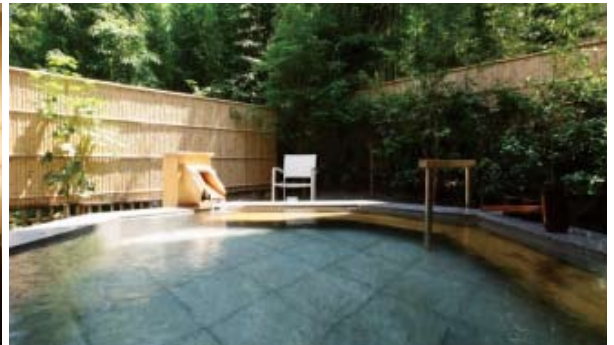
客室露天風呂、大浴場もすべて 自家源泉かけ流し

静岡県熱海市水口町11-48 Tel : 0557-86-3646 Fax : 0557-81-2363 【HP】 www.atamifufu.jp