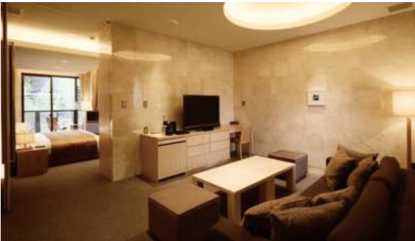
全室ラグジュアリースイートの客室