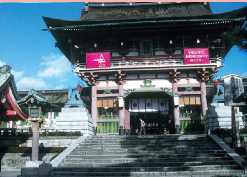
伏見稲荷大社正面

お正月には自宅より徒歩十五分位にある伏見稲荷大社へ初詣でに行く事になっている。今年も年初三ケ日は人出に恐れをなして敬遠したが、四日には今年一年の幸福を願って敬虔なる祈りを捧げお賽銭を差し上げた。毎年している事であるがその上二百円を張り込んで御神籤を引いてみたら何と何と三十番大吉と出てきた。サア今年も良いことがあるようにと期待をこめて松の内を過ぎてしまった。年賀状は今年も沢山頂戴した。輪ゴムで括って座敷机の横に置いて何時でも調べられる様にしてあったが、籤の当選発表の日を忘れてしまい、当選番号の載った新聞も何処かへやってしまった。一月下旬になって京都の中央郵便局へはがきを買いに立ち寄ったら当選番号を記載したリーフレットが置いてあった。コレハコレハと早速一枚頂戴し家に持って帰った。夕食後暇が出来たので見えない老眼を励まして年賀はがきの番号を調べてみた。