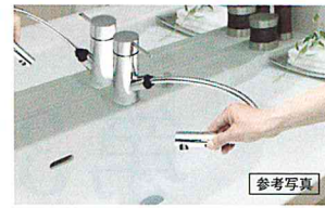
マルチシングルレバー水栓