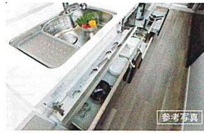
引き出し式のキッチンキャビネット