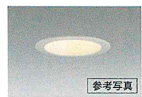
(住戸内ダウンライト)