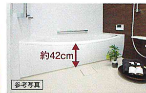
出入りがしやすいユニットバス 約42cm