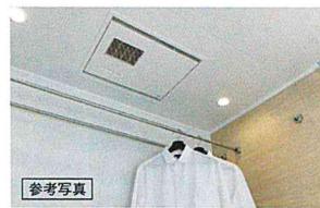
浴室暖房換気乾燥機