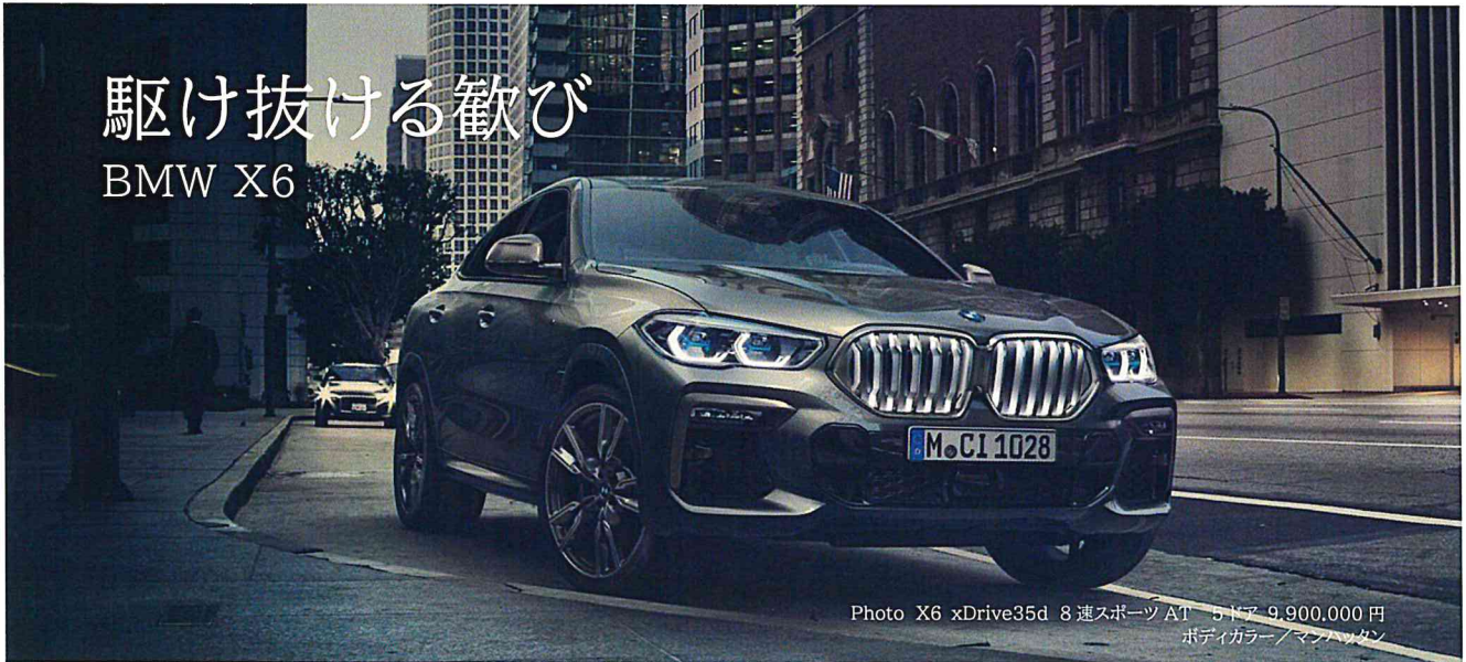
Photo X6 xDrive35d 8速スポーツAT 5ドア 9,900,000円 ボディカラー/マフレッサー

BMW から特別ご優待のご案内です。この機会に是非新型 BMW 車をご検討ください。