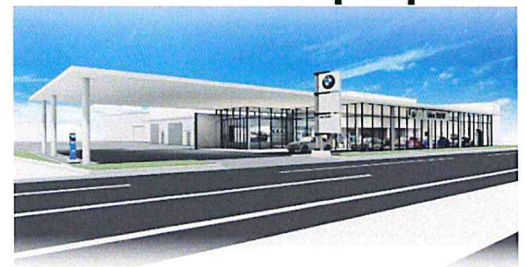
I dex BMW 宮崎中央店/花ヶ島町柳の丸528-1