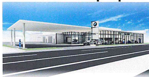
● I dex BMW 宮崎中央店/花ヶ島町柳の丸528-1