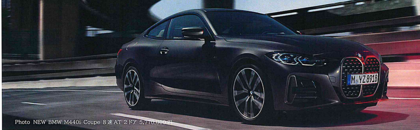
Photo NEW BMW M440i Coupe 8速AT 2ドア 5,770,000円

BMW から特別ご優待のご案内です。この機会に是非新型 BMW 車をご検討ください。