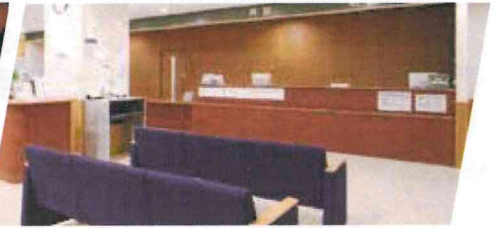
伊東内科クリニック 様 待合室と診療室に設置させていただきました。