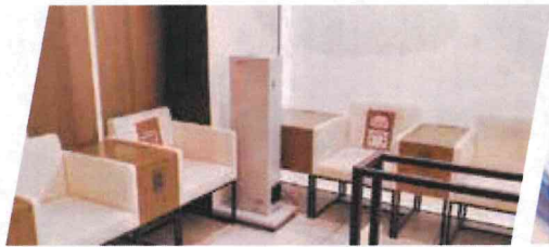
中部国際空港セントレア 様 プレミアム ラウンジに設置させていただきました。