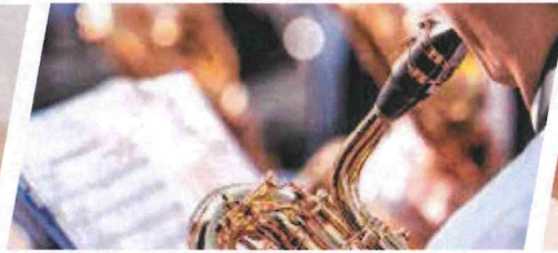
名古屋音楽大学 様 オーケストラ練習教室に設置させていただきました。