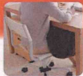
マイルーム・勉強机に