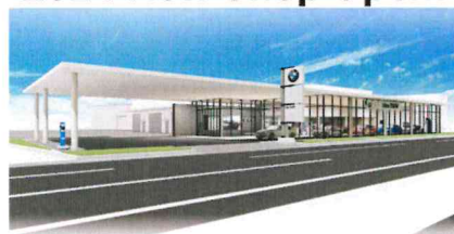
I dex BMW 宮崎中央店/花ヶ島町柳の丸528-1