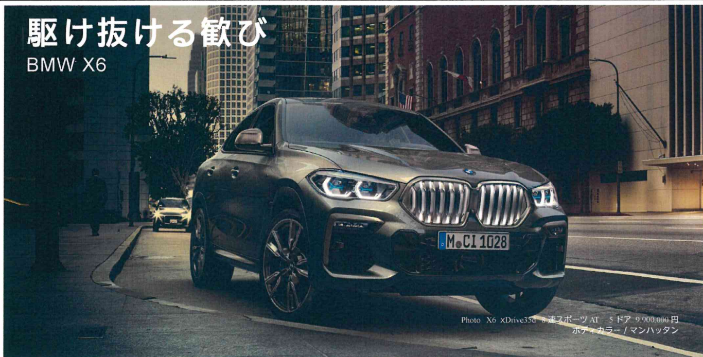
Photo X6 xDrive35d 速スポーツ AT 5ドア 9,900,000円 ボディカラー/マンハッタン

BMW から特別ご優待のご案内です。この機会に是非新型 BMW 車をご検討ください。