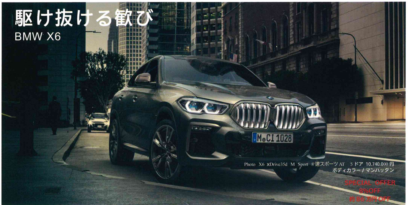
Photo X6 xDrive35d M Sport 8速スポーツAT 5ドア 10,740,000円 ボディカラー/マンハッタン

BMW から特別ご優待のご案内です。この機会に是非新型 BMW 車をご検討ください。