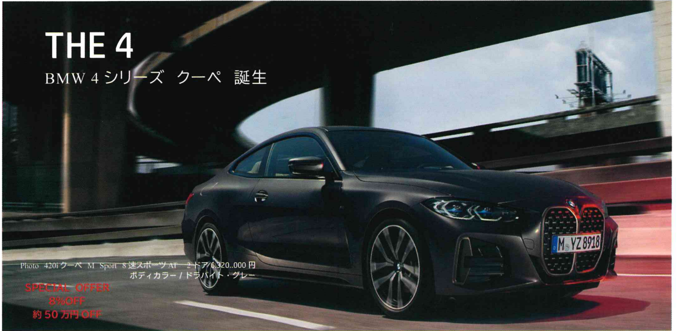
Photo 420i クーペ M Sport 8速スポーツAT 2ドアクーペ ¥6,320,000 円 ボディカラー / ドライバイト・グレー