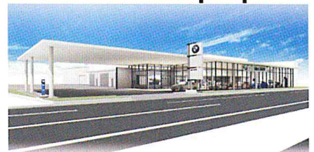
○ I dex BMW 宮崎中央店/花々島町柳の丸528-1