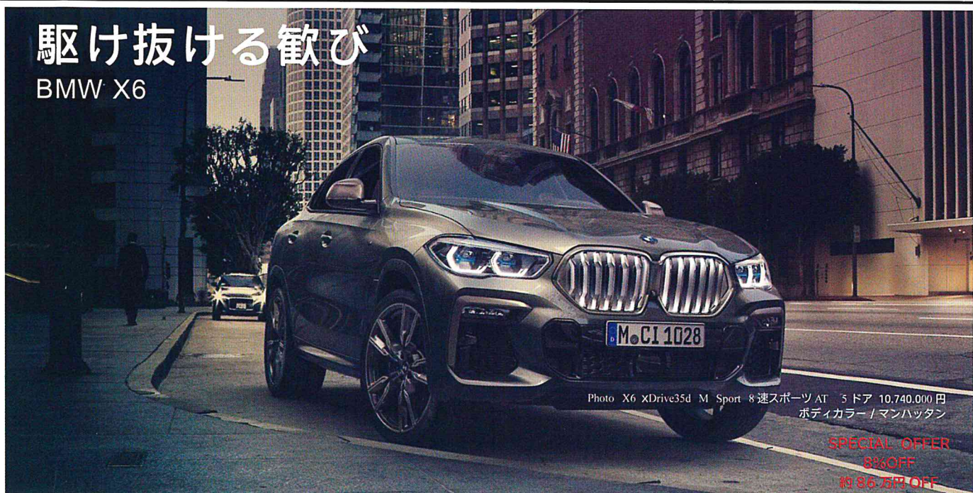
Photo X6 xDrive35d M Sport 8速スポーツAT 5ドア 10,740,000円 ボディカラー/マンハッタン