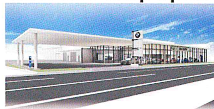
◎ I dex BMW 宮崎中央店/花ヶ島町線の丸520-1