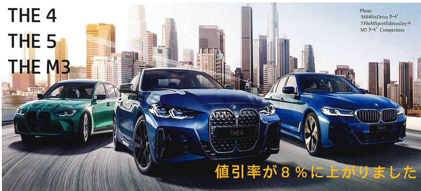
Photo M440i xDrive クーア* 530e M Sport Edition Joy+ M3 クーア* Competition