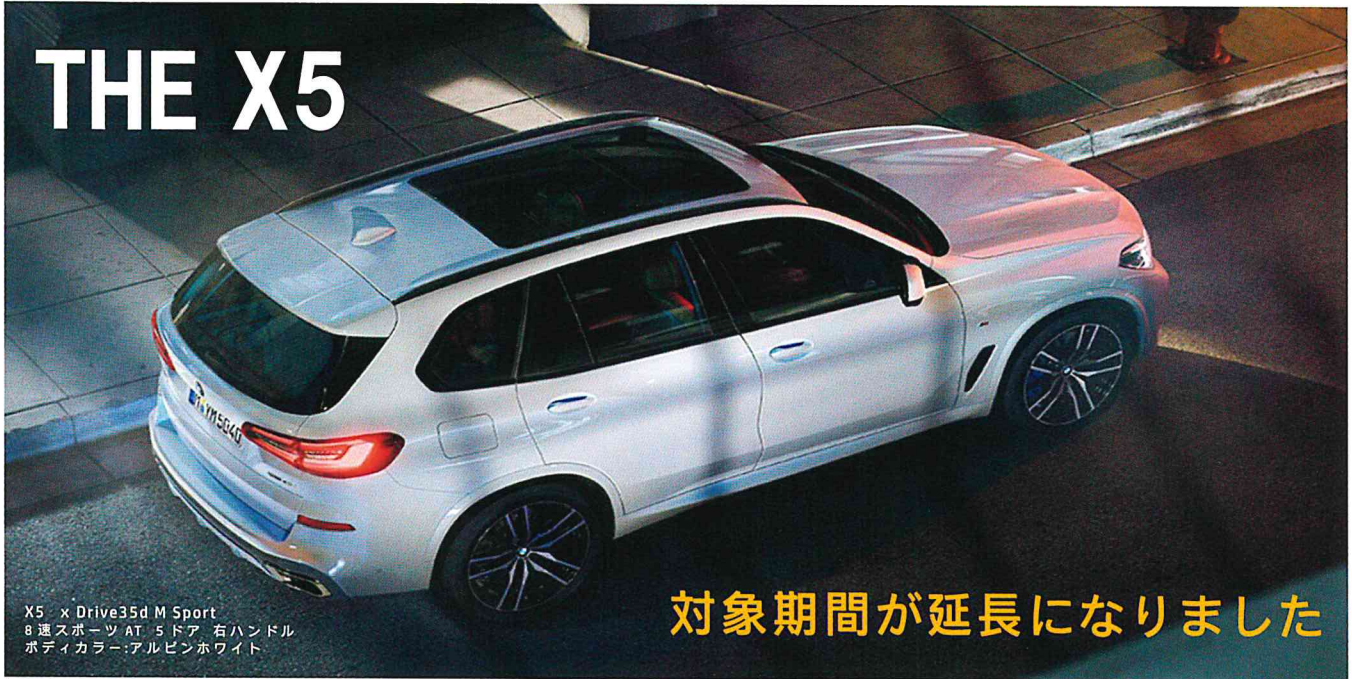
X5 xDrive35d M Sport 8速スポーツ AT 5ドア 右ハンドル ボディカラー:アルビノホワイト