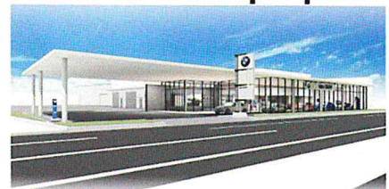
● I dex BMW 宮崎中央店/花ヶ島町柳の丸528-1