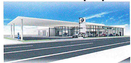
● IDEX BMW 宮崎中央店 / 花ヶ島町柳の丸528-1