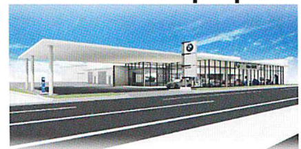
● I dex BMW 宮崎中央店 / 花ヶ島町柳の丸528-1