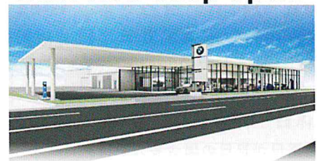
◎ IDEX BMW 宮崎中央店 / 花ヶ島町柳の丸528-1