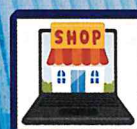
ネットショッピング