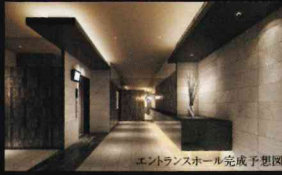
エントランスホール完成予想図