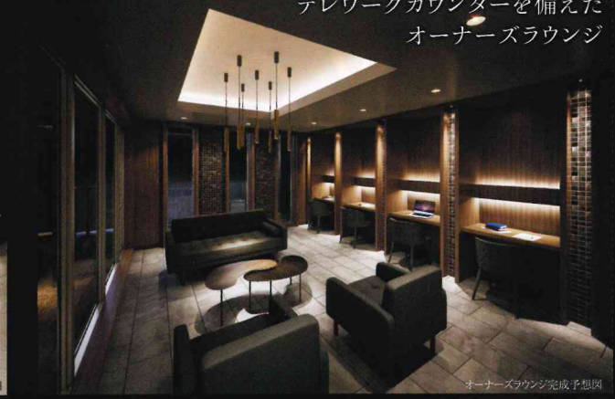
オーナーズラウンジ完成予想図