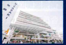
アミュープラザみやざき※1 徒歩11分(約880m)