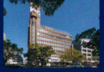
カリノ宮崎 徒歩8分(約640m)