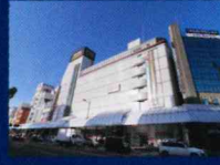
宮崎ナナイロ 徒歩6分(約450m)