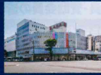
宮崎山形屋 徒歩6分(約430m)