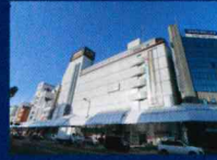
宮崎ナナairo 徒歩6分(約450m)