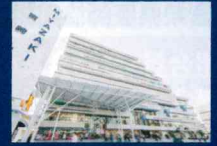
アミュープラザみやざき※1 徒歩11分(約880m)