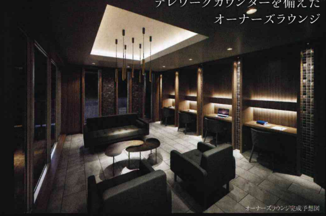
オーナーズラウンジ完成予想図