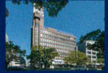
カリノ宮崎 徒歩8分(約640m)