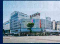
宮崎山形屋 徒歩6分(約430m)