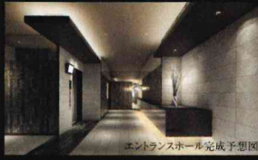
エントランスホール完成予想図