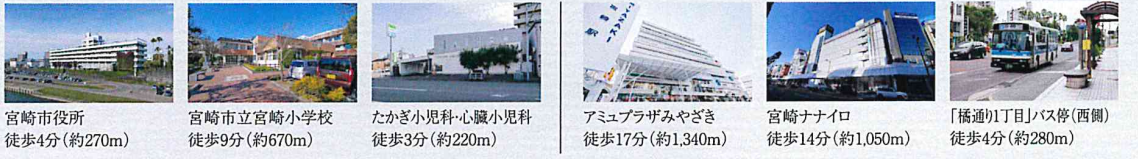
宮崎市役所 徒歩4分(約270m) | 宮崎市立宮崎小学校 徒歩9分(約670m) | たかぎ小児科・心臓小児科 徒歩3分(約220m) | アムプラザみやざき 徒歩17分(約1,340m) | 宮崎ナナイロ 徒歩14分(約1,050m) | 「橋通り」目1バス停(西側) 徒歩4分(約280m)