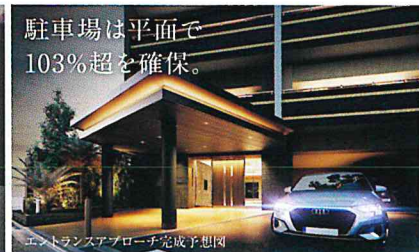
エントランスアプローチ完成予想図